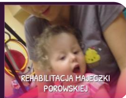
REHABILITACJA MAJECZKI POROWSKIEJ