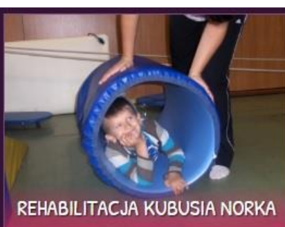
REHABILITACJA KUBUSIA NORKA