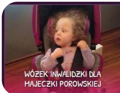
WÓZEK INWALIDZKI DLA MAJECZKI POROWSKIEJ