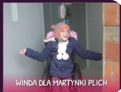
WINDA DLA MARTYNIKI PLICH