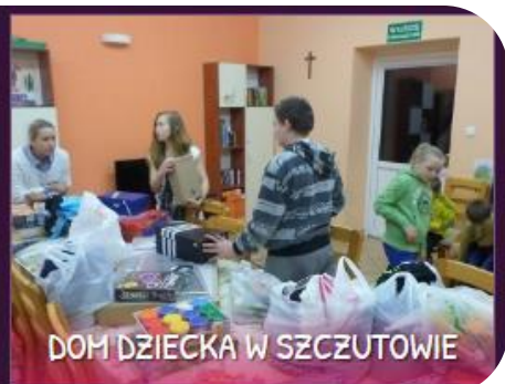
DOM DZIECKA W SZCZUTOWIE