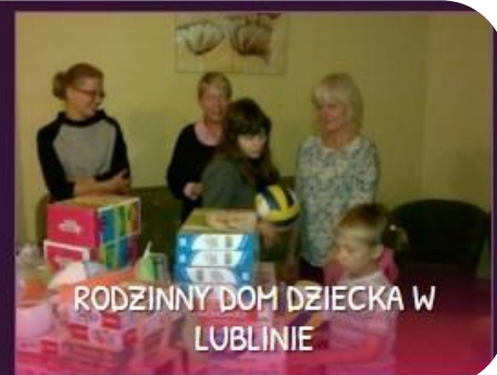
RODZINNY DOM DZIECKA W LUBLINIE