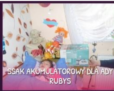
SSAK AKUMULATOROWY DLA ADY RUBYS