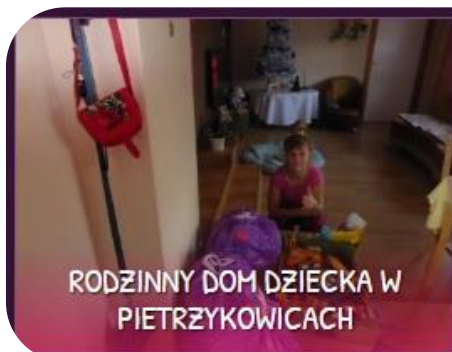
RODZINNY DOM DZIECKA W PIETRZYKOWICACH