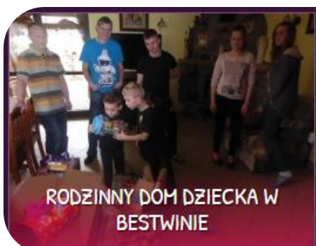
RODZINNY DOM DZIECKA W BESTWINIE