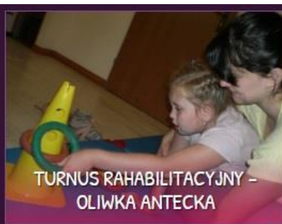
TURNUS RAHABILACYJNY - OLIWKI ANTECKA