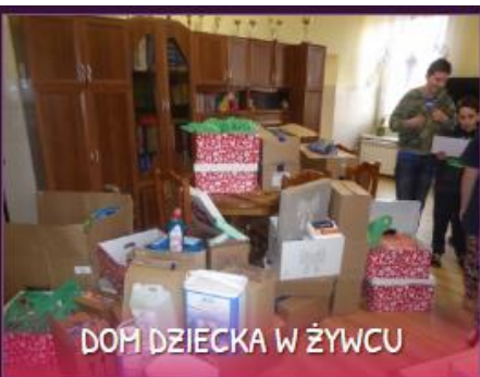
DOM DZIECKA W ŻYWCU