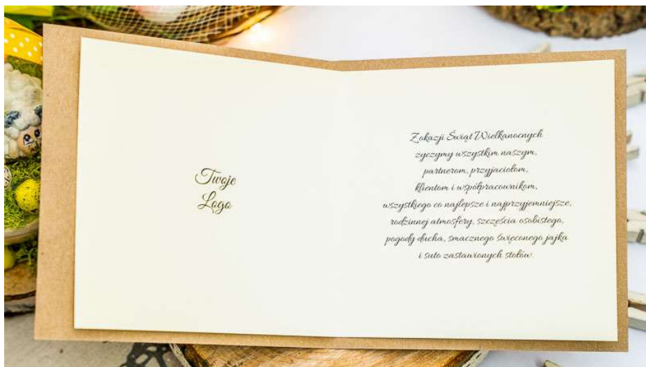
Przykładowy wydruk wnętrza

PAPIER PERŁOWY LUB EKOLOGICZNY 250G WKLEJKA: BIAŁA LUB KREMOWA 120G FORMAT: 13X13 CM, KOPERTA BIAŁA 14X14CM NADRUK LOGO WE WNĘTRZU, TEKSTU ŻYCZEŃ CZY PODPISÓW W CENIE KARTKI